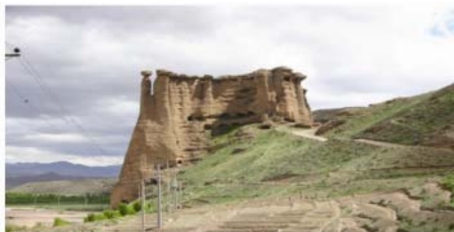
تصویر شماره ۴: قلعه ی قهستان ، مفهوم درون و برون