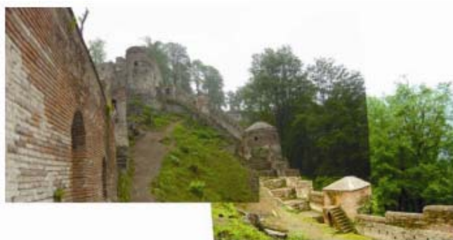
تصویر شماره ۵: قلعه رودخان، مفهوم درون و برون - مرزهای مکان

کاربرد مکان ، اصطلاح کاربرد مکان نه تنها کاربرد ساختمان‌ها و مکان‌های زیستن و تلاش آدمی را شامل می‌شود، بلکه به خود کاربرد مکان چونان یک کلیت اشاره دارد. هنگامی که می‌گوییم از یک خیابان استفاده می‌کنیم یا آن را به کار می‌گیریم، الزاما نه بدان معنا است که فروشگاه یا دفتری در این خیابان داریم، بلکه بیشتر بدان معنا است که ما از این خیابان، از آن حیث که خیابان است، استفاده می‌کنیم و بدین اعتبار خود را به رویداد هستی پذیری خیابان داخل و منضم می‌کنیم. از این رو کاربرد مکان در بر گیرنده‌ی همه‌ی معنایی است که از سود بردن مستفاد می‌شود، از کنش عملی گرفته تا معناها و سرانجام شرایط روحی و روانی. به واقع منظورمان سنت‌هایی است که کاربرد و عرف‌های زیست‌جهان را مشخص می‌سازد. استفاده از یک مکان به تعبیری دیگر معطوف است به یک کلیت فراگیر؛ ما آدمیان نه تنها از نهادهای اجتماعی همچون ساختمانها، مدارس و کلیساها استفاده می‌کنیم (سود می‌بریم) - بلکه از فضا برای استقرار نقطه‌ی پشتیبان وجود و هستی مان نیز بهره مند می‌شویم. به عبارتی کاربرد مکان هم به کنش و هم به مکان کنش اشاره دارد. این اصطلاح راهی را بیان می‌کند که زندگی و مکان در آن از یکدیگر جدایی ناپذیرند، از این رو مفهوم اصیل زیست‌جهان از آن حاصل می‌شود (شولتز، ۱۳۸۱: ۳۹). از سوی دیگر هویت انسان تابعی است از نقش و میزان مشارکت وی در هویت بخشی به یک مکان.