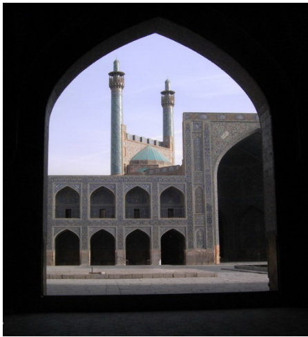
شکل ۵. صحن و ایوان ورودی مسجد امام اصفهان،

در معماری فضا نیز نهادینه بوده و قابل درک و فهم است (شکل ۵ مسجد امام اصفهان). پس میزان توفیق اثر به دو عامل بستگی دارد؛ اول میزان دست‌یابی هنرمند و یا صنعت‌گر به ذخیره الهی و یا میزان تقرب او به حق و حقیقت، و همچنین میزان برخورداری مخاطبین از ذخائر معنوی و روحانی که سبب کشف و تجربه باطن و پیام‌های درونی اثر می‌شود.