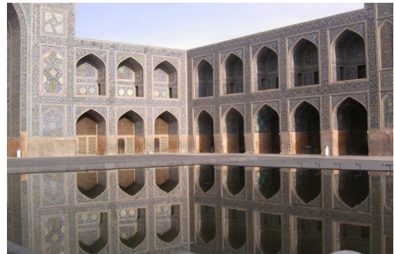
شکل ۴. آئینه آبی مسجد امام اصفهان صاحب نظران آن را نمونه‌ای از عالم مثال در معماری می‌دانند.

ذخیره الهی کشف و شهود کرده و بدان در کار خود، اشاره می‌کند. این اشاره همان مرکزی است که در آثار هنری معنوی، هم وجود دارد و هم وجود ندارد. لذا به‌طور اختصار می‌توان گفت که هنرمند معنوی کسی است که در کار خود «آنی» دارد.