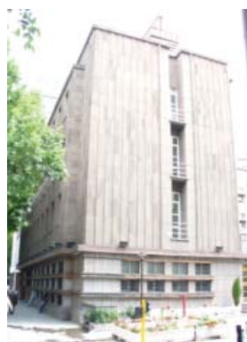
تصویر ۱۱. ساختمان بانک شهرداری ها، اثر آرکان، آنکارا، ۱۹۲۷