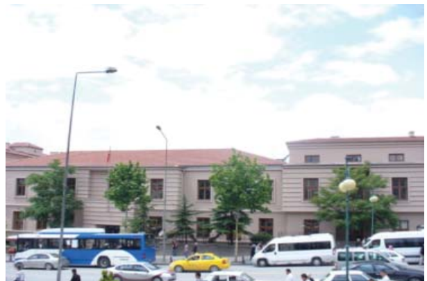
تصویر ۸. دادگاه استیناف مالی آنکارا

از جمله این ساختمان های این دوره می توان به موارد ذیل اشاره نمود. ۱- وزارت بهداشت، اثر تئودور پُست ۲۸ ، آنکارا، ۱۹۲۷ (تصویر ۷) ۲- دادگاه استیناف مالی، اثر ارنست اِگلی ۲۹ ، آنکارا، ۱۹۲۸-۱۹۳۰ (تصویر ۸) ۳- انستیتو دختران عصمت پاشا، اثر ارنست اِگلی، آنکارا، ۱۹۳۰ (تصویر ۹)