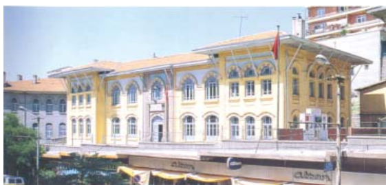
تصویر ۵. مدارس لطیف و غزلی، اثر موکیبل کمال بیگ، آنکارا