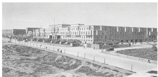
تصویر ۲. وزارت دفاع ملی - آنکارا ۱۹۲۷

"التقاط‌گرایی جدید یک تأثیر اساسی بر توسعه حرفه معماری داشت. یک برنامه آموزشی، مستقل از مهندسی، در آکادمی هنرهای زیبا شروع شد که در ۱۸۸۲ تأسیس شده بود. در عین حال مدرسه مهندسی معماری که در ۱۸۸۴ تأسیس شده بود. یک دوره آموزش معماری را ارائه می‌داد اما هنوز از مهندسی تفکیک نشده بود. ولوری ۱۰ در اولی و جکموندد ۱۱ در دومی تدریس می‌کردند. کمال الدین بیگ ۱۲ بنیان‌گذار سرشناس اولین جنبش معماری ملی، دانشجوی جکموندد بوده است. او پس از فارغ التحصیلی در ۱۸۹۱، به عنوان دستیار مدرس خود منصوب شد. در ۱۸۹۶ کمال الدین بیگ به مدرسه فنی شارلوت تنبوری ۱۱ در برلین فرستاده شد که در آنجا برای دو سال معماری خواند. سپس برای چندین آرشیوتکت، قبل از بازگشت به ترکیه در ۱۸۹۰ کار کرد. فرد دومی که نقشی پیشگامانه در توسعه اولین جنبش ملی معماری ایفا کرد، یعنی ودات تک ۱۲ ، آموزش معماری اش را در «مدرسه ملی هنرهای زیبا» قبل از بازگشت به فرانسه در ۱۸۹۷ گذراند. کمال الدین بیگ و ودات بیگ پس از بازگشت به ترکیه به ترتیب شروع به تدریس