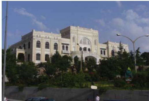
تصویر ۶: انجمن اخوت ترک

ویژگی های معماری عثمانی در نمای ساختمان ها همراه بود.