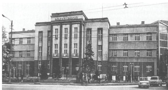
تصویر ۷. وزارت بهداشت، اثر تنودور پُست، آنکارا، ۱۹۲۷. مأخذ: Holod, 2005, 104

• رخاب ها و بام های شیبدار جای خود را به بام های تراسی دادند. ساختمان های با اسکلت بتون آرمه یا ساختمان با صفحات بتونی کم کم به طور گسترده ای استفاده شدند. گچ با تکنیک آلمانی روی سطوح نماهای جلویی استفاده شد " (Ibid: 26).