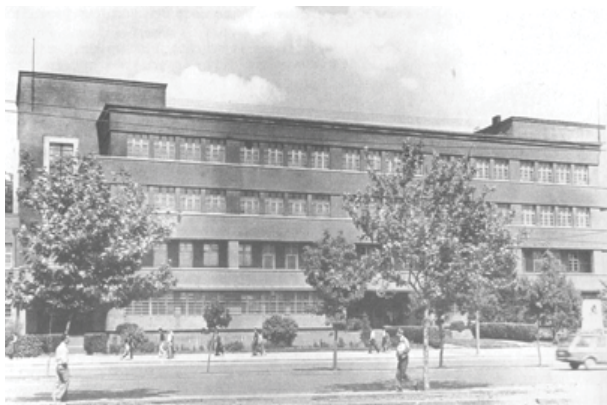
تصویر ۹. انستیتو عصمت پاشا برای دختران