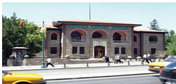
تصویر ۴. مجلس بزرگ ملی