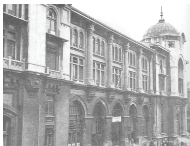
تصویر ۱. اداره مرکزی پست استانبول مأخذ: Holod, 2005, 46