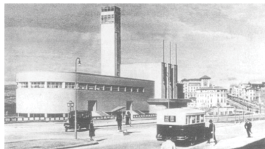
تصویر ۱۰. ساختمان نمایشگاه آنکارا، اثر سوکی بالمومکو