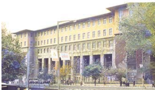
تصویر ۱۵. دانشکده های ادبیات علوم دانشگاه استانبول

مدرن غرب بهره گیری شد و ویژگی ملی گرایانه آن در اجزاء و عناصر معماری مثل پنجره ها، سر ستون ها و ... با استفاده از تکنیک های ساخت و مواد مدرن ظاهر شده است" (Ibid، 39). برخی از بناهای این گرایش بشرح ذیل می باشد. ۱- مدیریت کل راه آهن دولتی اثر بدری اوکار ۳۷ ، آنکارا، ۱۹۴۱ (تصویر ۱۴)