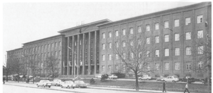
تصویر ۱۴. مدیریت کل راه آهن دولتی آنکارا

در کشور ترکیه جهت گیری به سمت معماری مدرن در سال های ۱۹۳۰ به عنوان پیش نیاز مدرنیزاسیون و رسیدن به گذر از یک پایه فرهنگ اسلامی - شرقی به یک پایه فرهنگ غربی مطرح شد. حرکت به سمت مدرنیسم در معماری کاملاً افراطی بود؛ که در بالاترین سطوح دولت با اتفاق آرا مورد پشتیبانی قرار گرفت و در تمام سطوح با پیگیری دولت اجرا شد. هدف آشکارا بیان شده جمهوری، رسیدن به فرهنگ مادی و پیشرفت تکنولوژیکی غرب بود. بنابراین طبیعی بود که کارشناسان خارجی فراخوانی شوند. معماری مدرن پاسخی به شرایط و نیازهای ویژه فرهنگی و تکنولوژیکی بود.