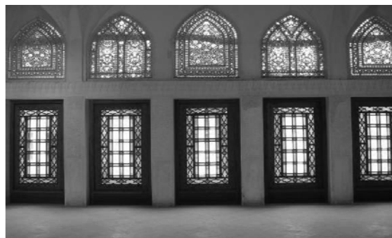
شکل ۵. مدخل ورودی اتاق‌های خانه‌ها

هشتی: بعد از درب ورودی اصلی محوطه‌ای قرار دارد، که از یک سو از آن طریق به کوچه و از طریق راهرو قاعدتا پریچ و خم و شیب دار به حیاط مرکزی راه دارد. «به‌طور کلی از علل وجود هشتی، جلوگیری از ورود هوای نامناسب بیرون به داخل خانه است، زیرا وقتی کسی وارد می‌شود، در را بسته و سپس در دیگر را برای ورود به دالان منتهی به داخل خانه و حیاط باز می‌کرده است و به این ترتیب تبادل هوا به داخل به حداقل کاهش پیدا می‌کرده است و میکرواقلیم درونی خانه