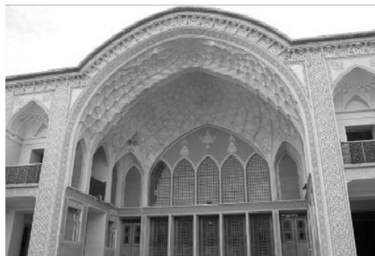
شکل ۴. قسمت شاه نشین یا بیرونی خانه

پنجره‌ها و ارسی: در مدخل ورودی اتاق‌ها از درهای چوبی با چارچوب استفاده می‌شده که علت آن محافظت فضای اصلی «خانه از ورود جانورانی مانند عقرب به داخل اتاق‌ها بوده است. ارسی علاوه بر زیباسازی اتاق‌ها، در ساعات متفاوت روز و شب می‌توانست نقش‌های متفاوتی را در تعدیل هوای اتاق و ایجاد گرما یا سرما ایجاد کند. جنس آنها از چوب بوده و علاوه بر کارکرد اصلی با منبت کاری روی آن به زیبایی اتاق می‌افزوده و در ترکیب با پنجره‌ها که در داخل آنها شیشه‌های رنگی به کاررفته فضای دلپذیری را در اتاق به‌ویژه در هنگام غروب آفتاب ایجاد می‌کرده‌اند. شیشه‌های رنگی دوجداره در پنجره‌ها علاوه بر اینکه حالت اکوستیک در فضای داخلی اتاق ایجاد می‌کرده بنا به اظهارات افراد مطلع محل، رنگین بودن آنها باعث فرار حشرات موذی از محیط مسکونی در کاشان بوده است.