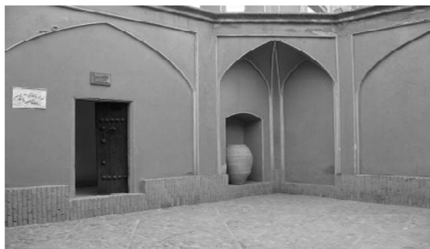
شکل ۷. حیاط خلوت خانه‌ها

حیاط خلوت: این بخش در پشت ساختمان اصلی با دیوارهای بلند محصور شده و از این رو اغلب دارای سایه بوده و در تمام اوقات روز اهالی خانه می‌توانند از سایه موجود استفاده کرده و با وجود حوض آب در آن می‌توانند در ساعات گرم روز که آفتاب شدید اجازه استفاده از حیاط مرکزی را نمی‌دهد، در جهت رفع نیازهای اهالی منزل کمک نماید. اتاق‌های سه دری و پنج دری در اطراف این حیاط بوده و غالباً اتاق‌های طبقات فوقانی از طریق پنجره با حیاط خلوت ارتباط دارند.