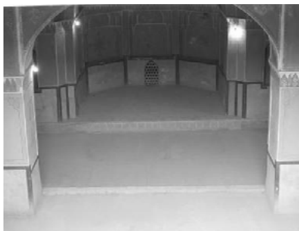
شکل ۴. دیوارهای بلند در اطراف خانه

زیرزمین: یکی از اصلی‌ترین اجزاء خانه‌های قدیمی در کاشان می‌باشد. در تابستان برای مصون ماندن از گرما به عنوان اصلی‌ترین محل زندگی شناخته شده و به صورت محدودتری وضعیت اندرونی و بیرونی در آن لحاظ گردیده است. به واقع در شرایطی که انطباق با محیط و ایجاد فضای مناسب برای زیستن بهینه مدنظر بوده هیچ‌گاه نقش محوری گفتمان حجاب فراموش نگردیده است. در فصل زمستان که اهالی خانه در طبقات همکف و یا بالا زندگی می‌کرده‌اند، زیرزمین به عنوان محلی برای نگهداری مواد غذایی مورد استفاده بوده است. این زیرزمین‌ها یا به صورت ساخته شده و یا به صورت کنده در دل زمین بوده، اصلی‌ترین نکته در این بخش از بنا، وجود بادگیرهای عمودی و افقی است که باعث گردش هوا شده و در پاره‌ای موارد وجود حوضخانه در جلوی زیرزمین به عنوان ورودی مقدماتی، این جریان گردش هوا را با رطوبت همراه ساخته و تاحدی از خشکی هوای کاشان در محیط زندگی، می‌کاهد. «موقعیت زیرزمین‌های مسکونی با توجه به اهمیت جبهه ساختمانی طبقه همکف متفاوت بوده است به این ترتیب که اگر بخش اصلی خانه در جبهه شمال بوده، در زیرزمین اصلی خانه در جبهه، شمالی بوده و اگر بخش اصلی خانه مثلاً در جبهه شرقی بوده، زیرزمینی نیز در جبهه شرقی بوده است» (آروینی و نیازی، ۱۳۸۵، ۹۲).