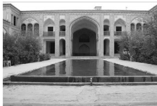
شکل ۲. حیاط مرکزی خانه

حیاط مرکزی: حیاط مرکزی نقش محوری در کل ساختمان داشته و عناصر و اجزاء خانه حول آن شکل گرفته‌اند. «در خانه‌های کاشان حیاط مرکزی نظم ارتباطی بین قسمت‌های تابستان نشین و زمستان نشین و همچنین فضای ارتباطی برای بهره برداری از سایر اجزاء خانه از جمله زیرزمین‌های جبهه‌های شمالی، جنوبی، شرقی و غربی است» (آروینی و نیازی، ۱۳۸۵، ۸۵). حیاط مرکزی با دارا بودن باغچه‌های بزرگ مملو از درخت و سبزه و حوض آب بزرگ، نقش مهمی در تلطیف هوا ایجاد می‌کند. بادگیرهای عمودی که مستقیماً به داخل سرداب راه دارند، از طریق بادگیرهای افقی و پنجره‌های روبه حیاط باعث می‌گردند، هوای خنک وارد حیاط شده و در ترکیب با رطوبت حاصل از تبخیر آب حوض، به‌خصوص در هنگام شب هوای خنک و دلپذیری به وجود آید و تا حدی گرمای طاقت فرسای محیط را تعدیل نماید.