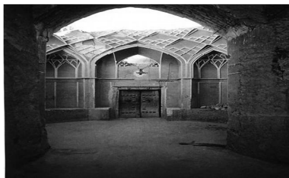
شکل ۸. هشتی (درب ورودی) خانه‌ها

هرسازمان اجتماعی براساس الگوی پارسونزی، چهار عملکرد اساسی را در برمی‌گیرد. اکثر خانه‌های تاریخی را باید به مثابه یک نظام و سازمان اجتماعی پویا و زنده تصور نمود. از این رو می‌توان گفت عناصر این خانه‌ها به جهت انطباق با محیط، کارکرد مناسب داشته و در عین حال به جهت وصول به هدف که آسایش و آرامش ساکنان خانه می‌باشد، طراحی شده‌اند در عین حال انسجام و وحدت کارکردی در خانه، از جهت چینش اجزاء به گونه‌ای است که علاوه بر هماهنگی