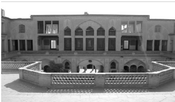
شکل ۶. محوطه وسیع خانه‌ها

به واقع کارکرد این بخش با زیرزمین متفاوت بوده و به جهت شرایط زیست اقلیمی کاشان استفاده خاص خود را دارد.