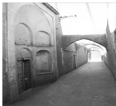
شکل ۳. دیوارهای بلند در اطراف خانه

دیوارها: دیوارهای بلند در اطراف خانه باعث جلوگیری از ورود بادهای گرم که همراه با شن و گرد و خاک هستند و از سمت کویر می‌وزند می‌شود. در زمستان بادهای سرد و سوزان کویری با وجود این دیوارها، نمی‌توانند وارد خانه شوند و در مجموع زیست اقلیم درونی محیط خانه و اتاق‌های اطراف آن می‌تواند هوای مناسب‌تری داشته باشد.