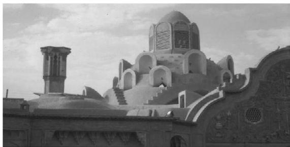
شکل ۹. بادگیرها خانه‌ها

محفوظ می‌مانده است، از دیگر علل وجود هشتی، جلوگیری از نگاه نامحرمان به داخل اندرونی خانه بوده است (آروینی و نیازی، ۱۳۸۵، ۱۰۰).