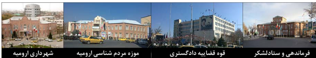
شکل ۲. میدان ایالت ارومیه