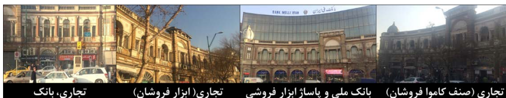
شکل ۳. میدان حسن‌آباد تهران

جای آن ساخته شد. این ساختمان متعلق به بانک ملی ایران بوده و اخیراً در پی بازسازی میدان در جلوی این نمای شیشه‌ای، سازه‌ای نمایشی شبیه به نمای دیگر بناهای میدان ساخته شد تا تمامیت فضای اولیه معماری میدان تا حدی بازگردد (شکل ۳). در ادامه و در جدول (۲ و ۳) به بررسی مدل عوامل تشکیل‌دهنده هویت مکانی در دو میدان ایالت و میدان حسن‌آباد پرداخته می‌شود.