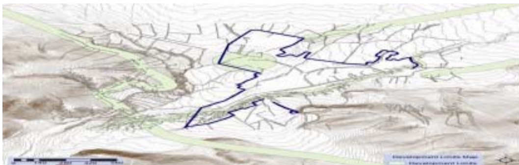
شکل ۱: نقشه کاربری اراضی شهر نالوس (برداشت میدانی توسط مولفین)

در این راستا فرایند توسعه شهری نالوس در GIS با در نظر گرفتن تمامی پارامترهای مطرح شده مدلسازی شده و سپس داده های مرتبط با آنها تهیه شده و آماده ورود به مدل ایجاد شده گردد. این لایه ها عبارتند از: نقشه توپوگرافی که از آن نقشه شیب، نقشه جهت شیب، راهها و معابر، رودخانه ها قابل استخراجند، نقشه خاک شناسی و زمین شناسی منطقه، نقشه سطح آبهای زیرزمینی و نقشه کاربری اراضی که توسط مولفین به کمک برداشت میدانی یروز شده است (شکل شماره ۱). ارتباط این لایه ها در مدل بصورت چارت (شکل شماره ۲). برای بررسی توسعه شهر نالوس توسط مولفین تهیه شده است. در مرحله بعد، این چارت در نرم افزار ArcGIS و به کمک Model Builder مدلسازی گشته و متناسب با داده های اولیه تهیه شده در مرحله قبل اجرا گردید و نتایج کار مورد ارزیابی قرار گرفت. لازم به ذکر است سایر اطلاعات توصیفی نظیر جمعیت و سرانه های استاندارد نیز وارد نرم افزار می گردد، سپس سرانه های موجود تعیین و با سرانه های استاندارد مقایسه می شود. بدین ترتیب کمبود های کمی خدمات (فرهنگی، آموزشی، تجاری و...) مشخص شده و میزان رشد آنها تعیین می گردد. این مهم به همراه اندازه مساحت ۵/۴ هکتار برای توسعه شهر نالوس در ارزیابیها نظر گرفته شده و محدودیتهای توسعه شهر نالوس با توجه به پارامترهای موثر تعیین گردید (شکل شماره ۳). در نهایت با توجه به پتانسیلهای توسعه و محدودیتهای توسعه برای شهر نالوس، نواحی مناسب توسعه مطابق شکل شماره ۴ تعیین شدند.