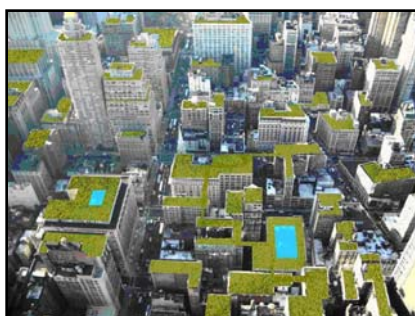
شکل ۲- سامانه بام سبز موضوعی است که در ایران ناشناخته مانده است که در صورت گسترش، مزایای بسیاری با خود همراه خواهد داشت. مأخذ: Sherman, 2005, 177

امروزه متناسب نمودن کمیت و کیفیت معماری به نخستین دغدغه معماران تبدیل شده است و در رویکرد زیست محیطی با عنوان‌هایی مانند «معماری پایدار» ۱ و «معماری سبز» ۲ بررسی می‌شود. درحالی که پیش از این تنها مؤسسات آموزشی و آژانس‌های دولتی بر ساخت ساختمان‌هایی مطابق با اولویت‌های زیست‌محیطی تأکید داشتند؛ هم‌اکنون مشاغل خصوصی هم هوادار ساخت چنین ساختمان‌هایی شده‌اند. در کشور کانادا و در سال ۲۰۰۰ تعداد ۴۵ ساختمان با مجموع زیربنای ۳ میلیون متر مربع به عضویت نظام راهبری انرژی و طراحی محیط ۳ که توسط شورای ساخت سبز ۴ راه‌اندازی شده بود درآمدند. این تعداد در حال حاضر به ۱۷۱ ساختمان تجاری رسیده است و ۱۸۰۰ ساختمان دیگر نیز برای این امر درخواست جواز نموده‌اند. حدود ۳۰۰۰ مهندس کانادایی دارای مجوز نظام راهبری انرژی و طراحی محیط هستند (Kanter, 2005, 47). در این تحقیق به ارائه معیارهای توسعه سامانه بام سبز در ایران خواهیم پرداخت. نگارندگان بر این موضوع تأکید دارند که در کشور ما بام سبز قبلاً ساخته شده است (شکل ۱) اما سامانه بام سبز موضوع کاملاً متفاوتی است که علی‌رغم توجه بسیاری از کشورهای توسعه یافته و حتی در حال توسعه به آن در کشور ما نه تنها غریب و ناآشنا می‌نماید بلکه تحقیقی در راستای توجیه پذیر نمودن آن صورت نگرفته است. (شکل ۲)