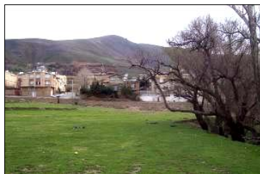
تصویر ۸- توان بالقوه وقوع سیلاب های مخرب در بخش بالادست و میانی