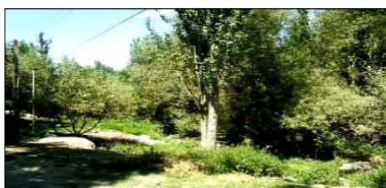
تصویر ۱۳- منظر خانه های ویلایی در بخش بالادست