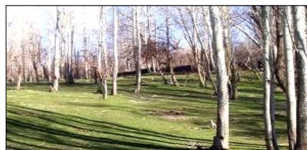
تصویر ۱۲- جریان مسیل در فصل پائیز