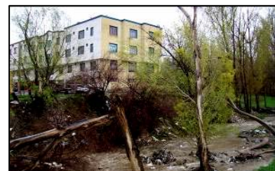
تصویر ۶- ظهور بناهای بلندمرتبه در بخش میانی