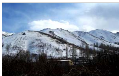
تصویر ۱۱- جریان مسیل در فصل تابستان