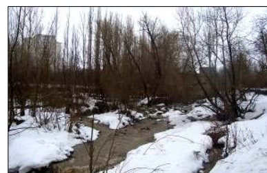
تصویر ۹- جریان مسیل در فصل بهار