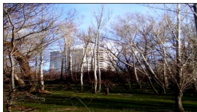
تصویر ۷- همجواری طبیعت با مسیل متروکه و مناطق مسکونی