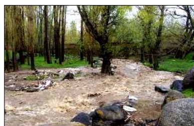
تصویر ۱۰- جریان مسیل در فصل زمستان