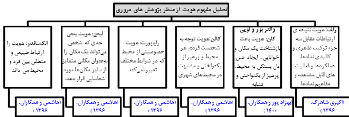
شکل ۱. مفاهیم هویت از منظر پژوهشگران Figure 1. Concepts of identity from the perspective of researchers