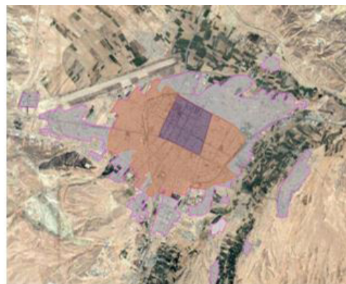
شکل ۱. الگوی کلی روند گسترش شهر بجنورد