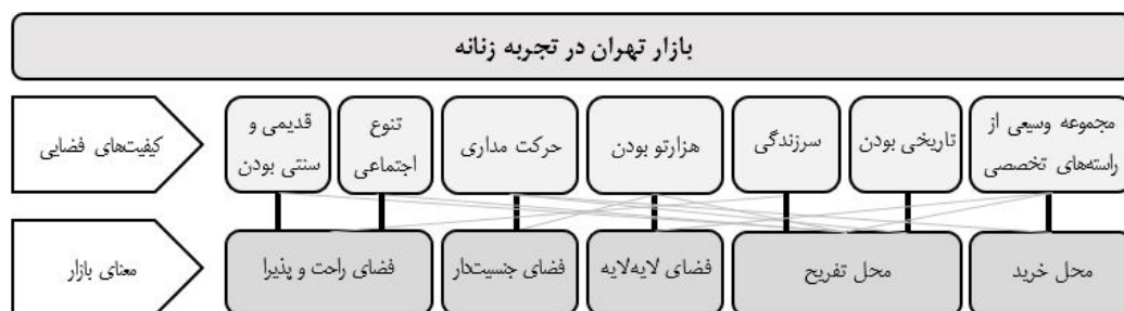
شکل ۳. رابطه معانی بازار با کیفیت‌های فضایی زمینه

توصیف ترکیبی: رابطه معانی بازار با کیفیت‌های فضایی زمینه اکنون لازم است رابطه توصیف نوشتاری و توصیف ساختاری روشن شود. همان‌طور که گفته شد بازار تهران در تجربه زنانه در قالب ۵ مضمون اصلی قابل توصیف: محل خرید/ محل تفریح/ فضای لایه‌لایه/ فضای جنسیت‌دار/ فضای راحت و پذیرا. در بخش توصیف ساختاری