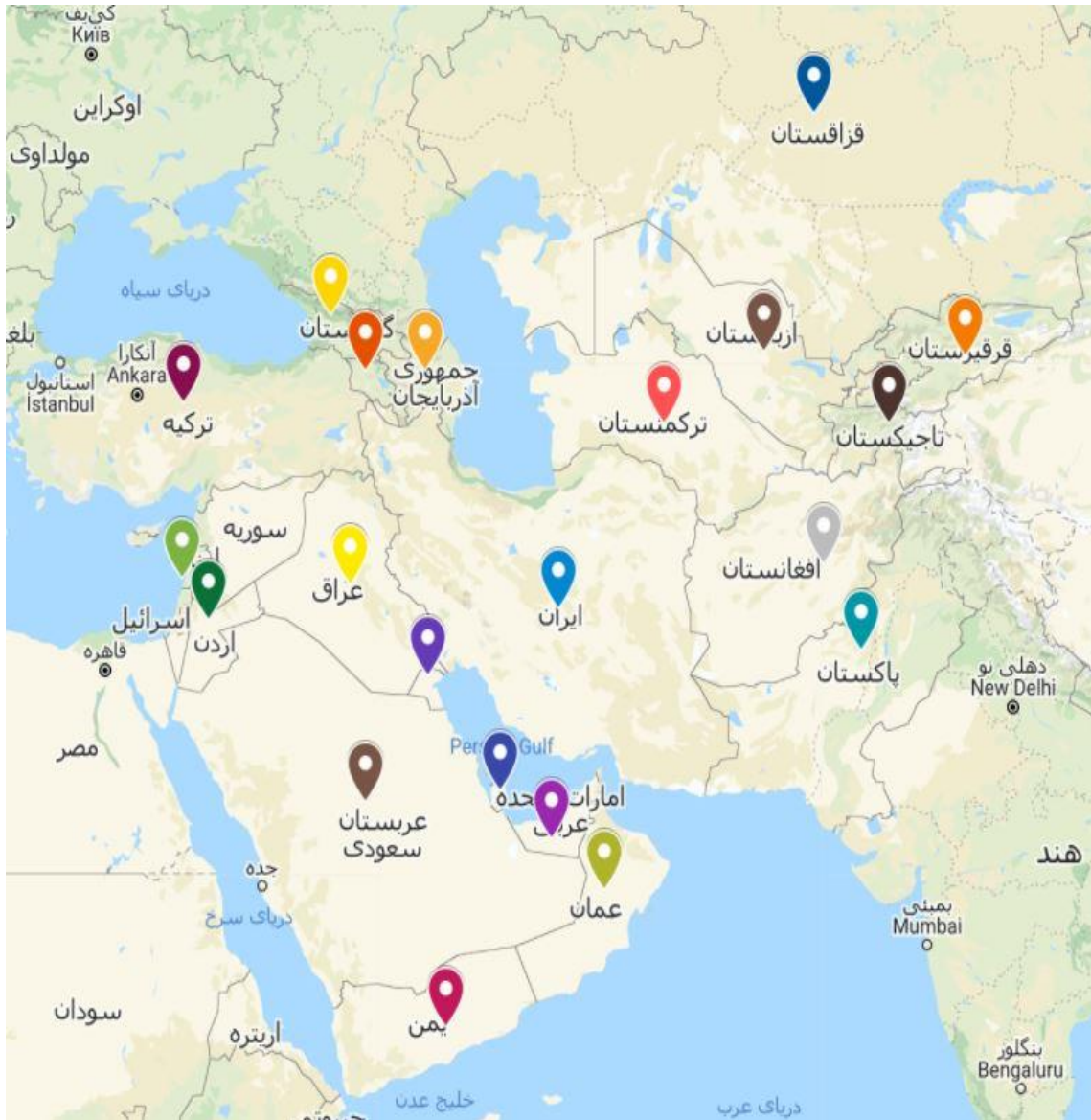
تصویر ۱ - فهرست کشورهای مورد مطالعه