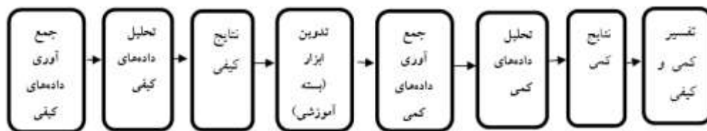
شکل ۱- طرح اکتشافی مدل تدوین ابزار با تأکید بر روش کمی

این مطالعه از لحاظ هدف کاربردی است زیرا نتایج آن برای برنامه‌ریزان و دست‌اندرکاران تدوین سیاست‌ها قابل استفاده است. مرحله اول این مطالعه ترکیبی، پژوهشی کیفی بود که در این راستا بسته‌ی آموزشی تفکیک پسماند مبتنی بر تحلیل موضوعی (مضمون) استقرایی تدوین گردید و پس از آن، مرحله کمی تعیین اثربخشی آموزش تفکیک پسماند انجام شد. در این پژوهش از روش تحقیق آمیخته و از گویه متوالی اکتشافی با طرح تدوین مدل استفاده شده است. به طور کلی پژوهش به روش آمیخته بیانگر نوعی پژوهش است که مستلزم گردآوری، تحلیل و تفسیر داده‌های کیفی و کمی در یک یا در چند مجموعه پژوهش است که پدیده مشابهی را مطالعه می‌کنند. طرح متوالی اکتشافی نیز شامل جمع‌آوری و تحلیل داده‌ها با روش تحقیق کیفی در مرحله اول و پس از آن به کارگیری نتایج آن برای جمع‌آوری و تحلیل داده‌های کمی است که در نهایت یک تفسیر و جمع‌بندی کلی از نتایج هر دو روش در قالب یک مطالعه انجام می‌گیرد. این طرح از لحاظ زمانی به صورت متوالی و از منظر وزن نیز بیشتر متوجه مرحله اول است (Creswell, 2012). شکل ۱ طرح اکتشافی مدل تدوین ابزار با تأکید بر روش کمی را نشان می‌دهد (Creswell & Clark, 2011).