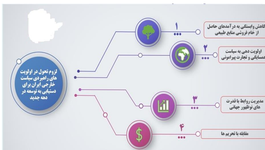
های لازم در سیاست خارجی ج.ا. ایران برای دستیابی به توسعه شکل شماره ۱- بایسته

به هر روی، حفظ امنیت و در سایه آن دستیابی به توسعه، دو خواسته اصلی سیاست معاصر ایران بوده است؛ با اینکه ریشه‌های طرح و منابع سازنده این دو خواسته متفاوت بوده‌اند و از ملی‌گرایی تا اسلام‌گرایی و مدرنیته تا سنت را شامل می‌شدند، مشخصات این مطالبات و همچنین مسائل مرتبط بر آن‌ها بسیار مشابه‌اند. در بیشتر مواقع ویژگی‌های متعارض توسعه و امنیت مدنظر قرار نگرفتند و در نتیجه سیاست‌هایی که برای تحقق یکی اتخاذ می‌شد، مانعی برای تحقق دیگری بود. تاریخ معاصر ایران سرشار از وضعیت‌هایی می‌باشد که اقدامات توسعه‌ای نتایج ضد امنیتی داشته‌اند یا سیاست‌های امنیتی وجوهی به شدت غیر توسعه‌ای یافته‌اند. بخشی از این پارادوکس‌ها اغلب در عرصه سیاست خارجی جلوه کرده‌اند. نمود این وضعیت در سیاست خارجی اغلب بدین وضع بوده است که سیاست خارجی با هدف تأمین امنیت، مانعی برای سیاست داخلی با هدف توسعه شده وضعیت که ایران امروز در حادثترین شکل ممکن با آن دست به گریبان است (جوادی‌ارجمند و دیوسالار، ۱۳۹۸: ۳۱۲). با این وجود، جمهوری اسلامی ایران از جمله کشورهایی است که در طی حیات خود کم و بیش به طور مستقیم یا غیرمستقیم از هر