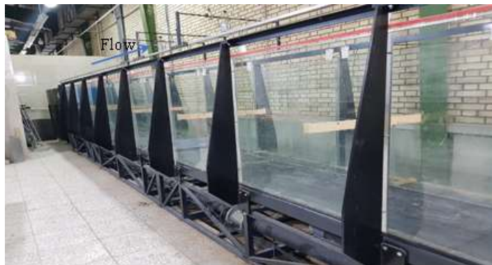
Fig 1. The laboratory channel