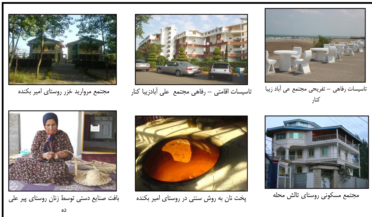
مجتمع مروارید خزر روستای امیر بکنده