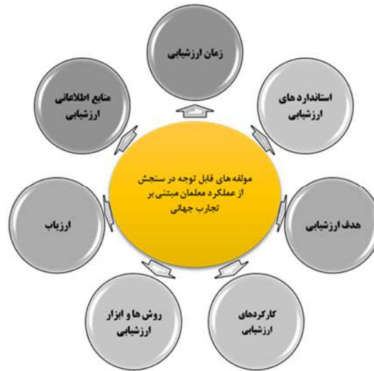
شکل ۱. مولفه‌های قابل توجه در سنجش از عملکرد معلمان مبتنی بر تجارب جهانی

استانداردها، فرایندها، ابزارها و پیامدها برای ارزشیابی عملکرد معلمان در این کشورها را استخراج نمود. در جداول زیر استانداردها و اصول ارزیابی پرداخته شده است. دسته‌بندی آنها بر اساس اجباری، پیشنهادی یا غیرپیشنهادی بودن در هر کشور انجام شده است. با وجود تنوع رویکردها، بر مجموعه‌ای از اصول و مولفه‌های کلیدی برای ارزشیابی مؤثر عملکرد معلمان ابتدایی تأکید می‌شود.