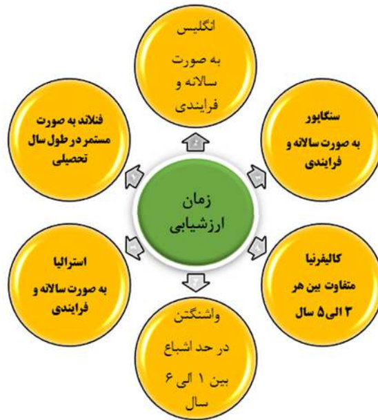
شکل ۲. زمان سنجش مطلوب عملکرد معلمان مقطع ابتدایی بر اساس تجارب جهانی