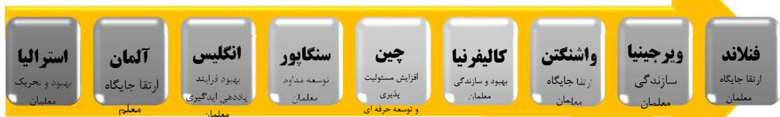
شکل ۳. هدف سنجش مطلوب از عملکرد معلمان مقطع ابتدایی بر اساس تجارب جهانی

با توجه به تجارب جهانی کشورهای پیشرو، اولین عنصر بررسی شده در نظام سنجش از عملکرد معلمان، معطوف به هدف ارزشیابی می‌شود. این عنصر همانند چتری دیگر عوامل موجود در ارزشیابی را در بر می‌گیرد و به آن‌ها جهت می‌بخشد. با توجه به جداول که به بررسی نظام سنجش معلمان در کشورهای پیشرو می‌پردازد، می‌توان نتیجه گرفت که بهبود و توسعه حرفه‌ای معلمان مهم‌ترین هدف سنجش از عملکرد معلمان در میان این کشورها قلمداد می‌شود.