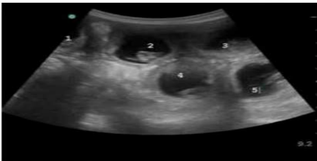
شکل ۳- سونوگرافی در روز ۲۶ آبستنی