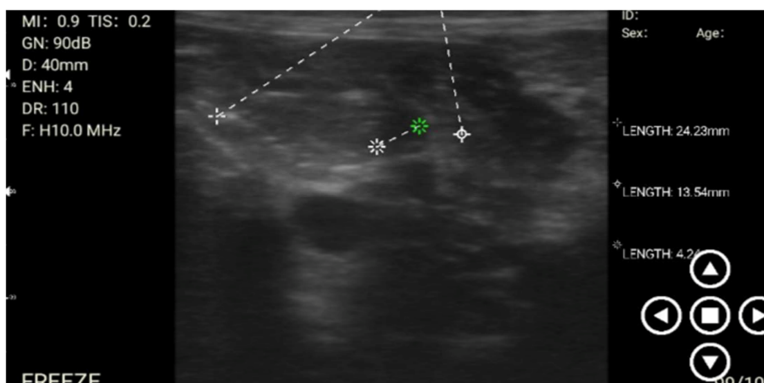
شکل ۱- فولیکول‌های موجود بر روی تخمدان روز ۶ پرواستروس