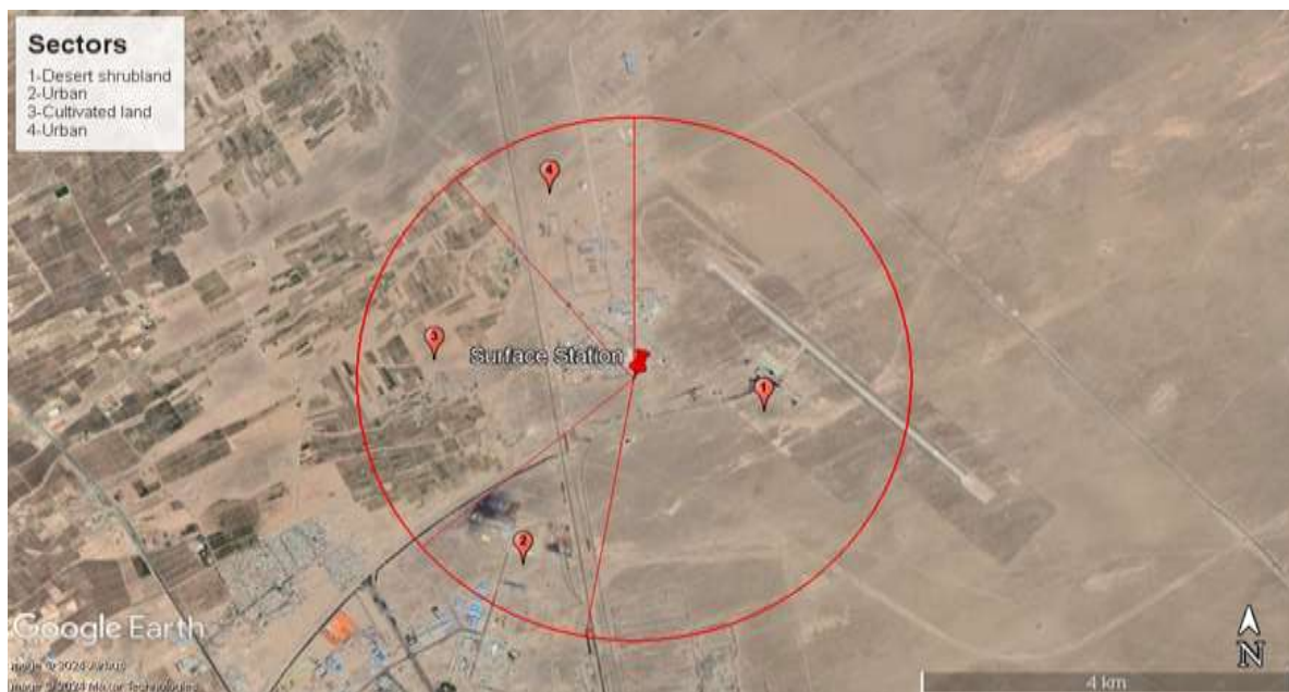
شکل ۲- سکتور بندی ایستگاه سینوپتیک سیرجان