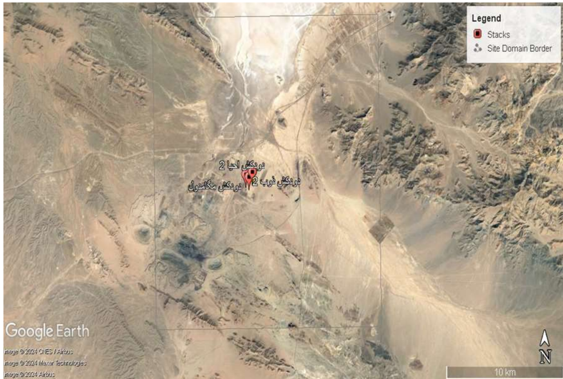
شکل ۳- محدوده مدل‌سازی آلودگی هوا برای شبکه‌بندی (۲۰*۲۲ km)

برای افزایش دقت مدل‌سازی، از مدل رقومی ارتفاعی (DEM) با اندازه پیکسل ۹۰ متر استفاده شد. این نقشه‌های توپوگرافی به تعیین دقیق‌تر مسیر و سرعت جریان آلاینده‌ها در منطقه کمک کردند. اطلاعات جغرافیایی و توپوگرافیک منطقه نیز در نرم‌افزار AERMOD وارد شدند تا تأثیر عوارض زمین بر پراکنش آلاینده‌ها به‌درستی تحلیل گردد (Smith et al., 2020).