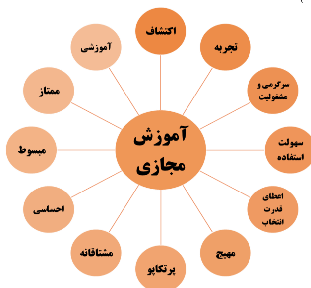
نمودار ۲-ویژگی‌های آموزش مجازی

روش‌های آموزش در محیط مبتنی بر فن‌آوری‌های جدید ویژگی‌های از قبیل یادگیری به شکل غیرهم‌زمان و فارغ از محدوده‌ی فیزیکی، انتقال تجارب واقعی در فرایند یادگیری، امکان تعاملات اجتماعی در فضای آموزش مجازی، انجام فعالیت‌های یادگیری مشارکتی و مهم‌ترین خصیصه‌ی آموزش مجازی، مزیت رقابتی به صورت مدیریت اطلاعات فرامتنی ۴ است (حسینیان و همکاران، ۲۰۲۰). روش‌های آموزش مجازی، کیفیت در آموزش از راه‌دور را بهبود می‌بخشد و هنگامی که مانعی وجود نداشته باشد، مخاطبین امکان انتخاب و مشارکت در موضوع‌های مختلف را دارند (نیستانی و همکاران، ۱۳۹۰).