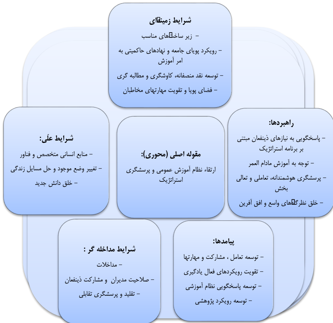
شکل ۱- مؤلفه‌های پرسشگری استراتژیک در جهت توسعه پایدار نظام آموزش عمومی