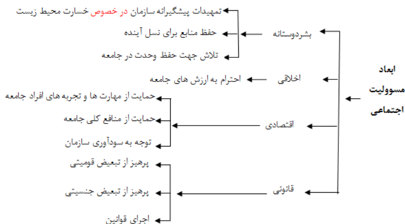
نمودار ۱. مدل مفهومی پژوهش برگرفته از نظریه کارول

با استناد به مبانی نظری، مدل مفهومی پژوهش با توجه به ابعاد و مؤلفه های اثرگذار در حوزه مسوولیت اجتماعی به شرح زیر تدوین می شود. مدل مذکور با توجه به کامل بودن مدل کارول برگرفته از این دو نظریه پرداز است. با استفاده از این مدل و نتایج محقق ساخته مدل مطلوب مسوولیت اجتماعی در سازمان تأمین اجتماعی طراحی گردید.