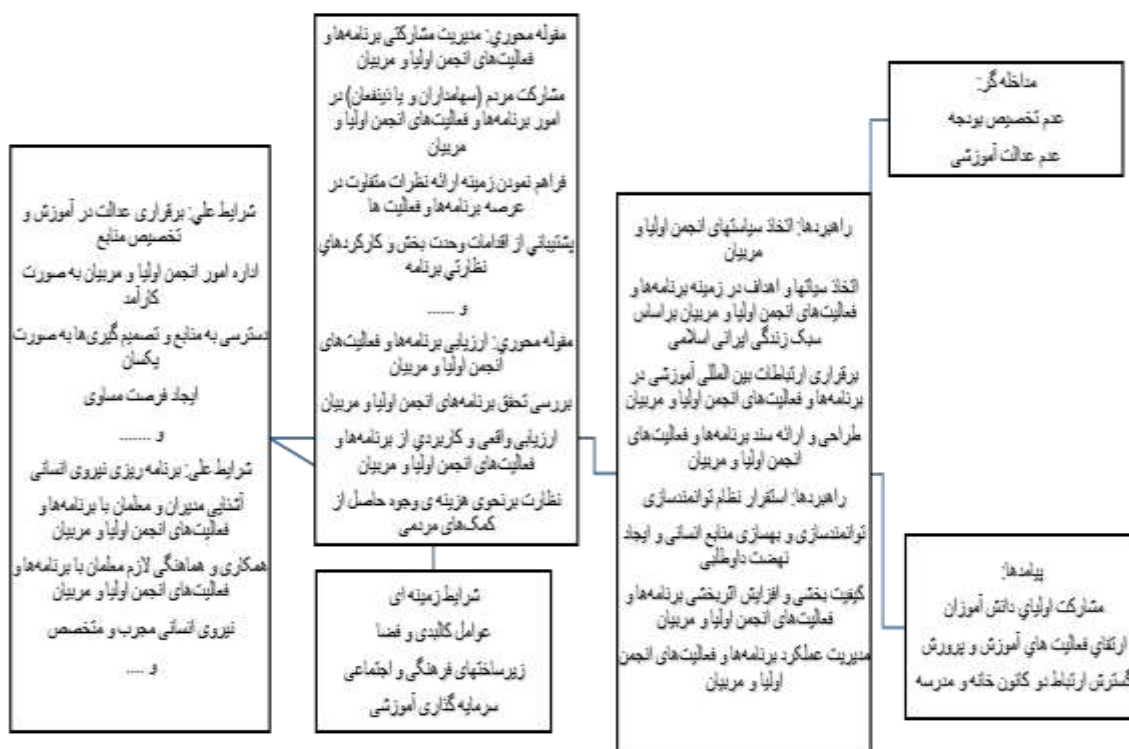
شکل ۱. کدگذاری محوری بر اساس الگوی پارادایم

در این تحقیق کدگذاری محوری بر اساس استفاده از الگوی پارادایم صورت گرفته است. بنابراین دسته‌بندی‌های فرعی با دسته‌بندی اصلی مطابق با الگوی پارادایم مرتبط می‌شوند و هدف اصلی این است که محقق را قادر سازد تا به صورت نظام مند در مورد داده‌ها و مرتبط کردن آنها تفکر کند. شکل ۲، ایجاد ارتباط بین مقوله‌های مختلف شناسایی شده را در قالب الگوی پارادایم نمایش می‌دهد.