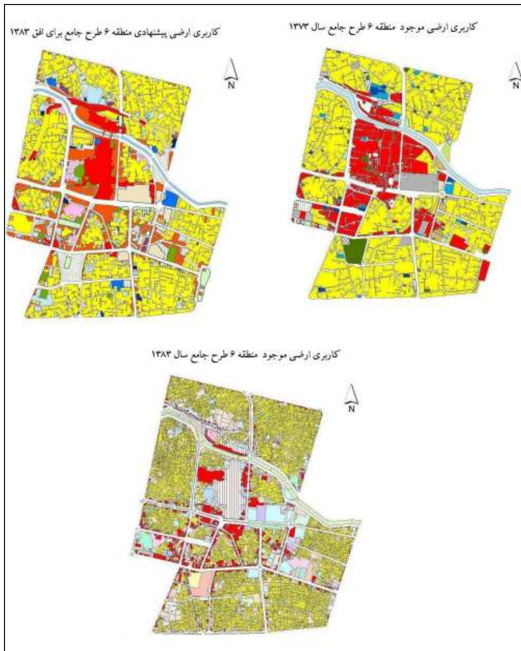
شکل ۲: تحقق پذیری کاربری اراضی منطقه ۶ طرح جامع (۱۳۷۳-۱۳۸۳) مأخذ: نگارندگان

مسایل و امکانات خاص گردیده است. در این فضا مؤلفه‌های درون زای منطقه شامل توان و قوت‌های نگهبان، نقاط ضعف و کمبودهای بازدارنده توسعه مرکز کلان شهری است. نیروهای بیرونی نیز