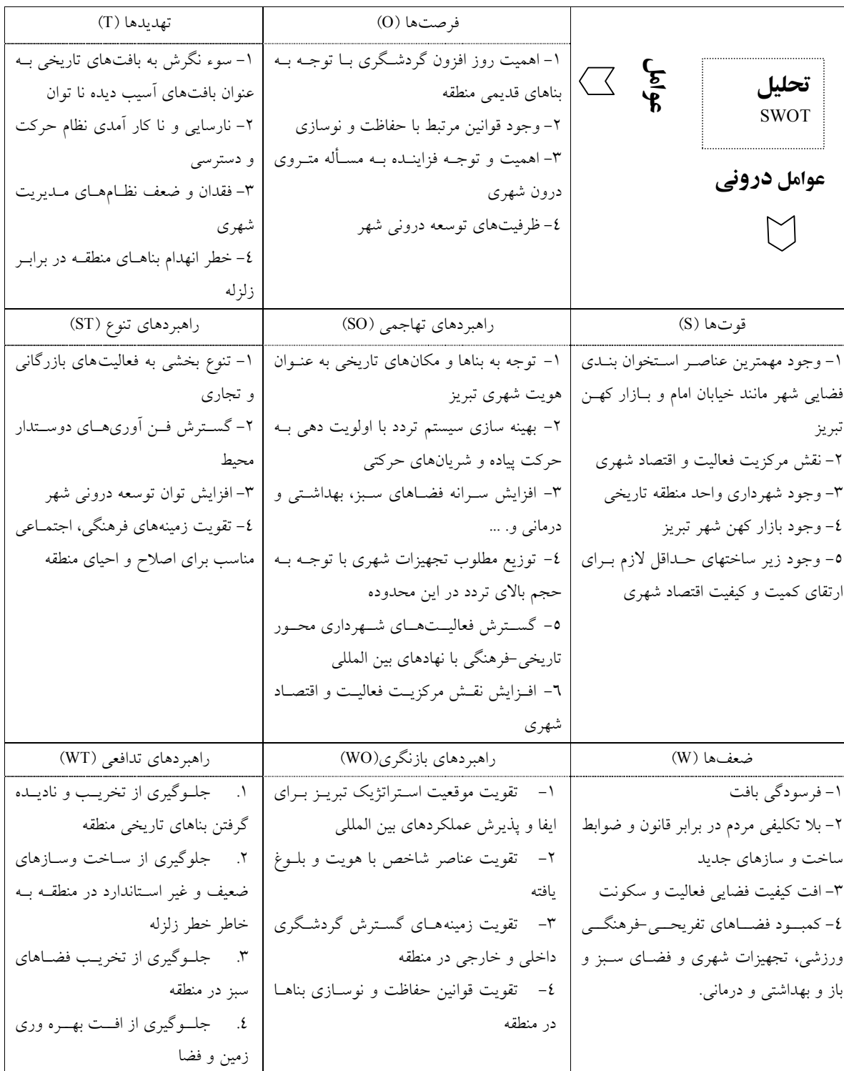
جدول ۵: راهبردهای مشترک گروه کارشناسان و استادان درباره اولویت‌های راهبردی اقدامات تحقق‌پذیری طرح جامع در محور تاریخی-فرهنگی (منطقه ۶)