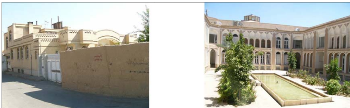
شکل ۲- یک نمونه خانه و یک نمونه مسکن

مسکن جدید (مهندسین مشاور آرمانشهر، ۱۳۸۶: ۵). در شکل شماره دو نمونه از خانه قدیمی و مسکن امروزی در شهر یزد نشان داده شده‌است.