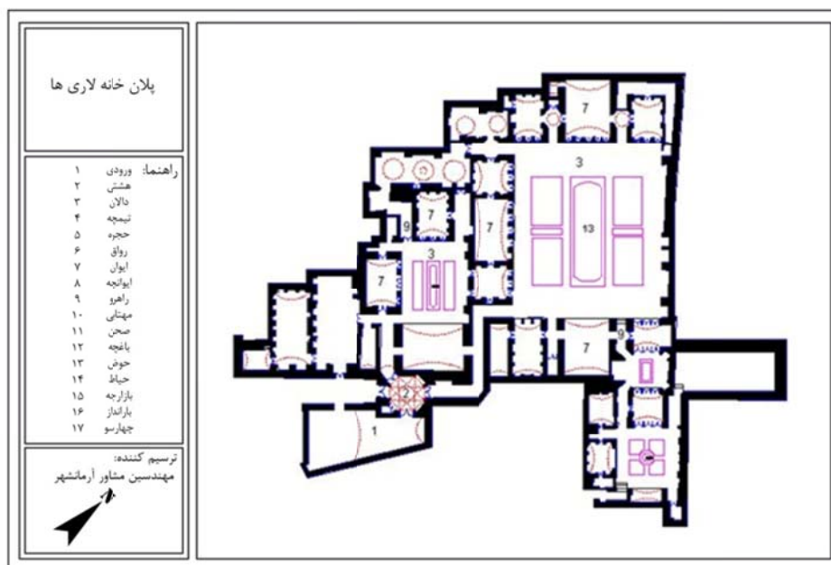
شکل ۱- پلان و اجزاء خانه لاری‌ها

پایاب محل دسترسی به آب قنات در حیاط خانه‌ها و مساجد است و نمونه‌های عمومی آن نیز در