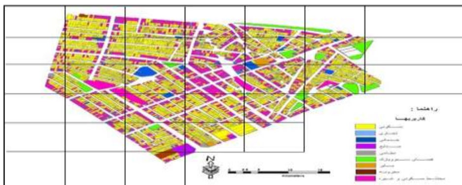
شکل ۱- نقشه محله خاک سفید منطقه ۴ شهرداری تهران

محدوده نمونه مورد مطالعه، در شمال شرقی پهنه شهری تهران و در منطقه چهار شهرداری تهران واقع شده است. شهرداری منطقه ۴ با مساحتی معادل ۶۱۲۸۸۳۶۷ متر مربع در قسمت شمال شرقی تهران قرار گرفته است. در حال حاضر ۸۰۳۷۸۹ نفر در این منطقه سکونت دارند. از این تعداد ۴۱۳۷۶۱ نفر مرد و ۳۹۰۰۲۸ نفر زن هستند (مرکز آمار ایران، ۱۳۸۵). در این من - طبقه ۲۳۰۰۳۶ خانوار سکونت دارند. در حال حاضر ۹ ناحیه و ۲۰ محله در سطح منطقه ۴ شهرداری تهران وجود دارد. محله خاک سفید در ناحیه شش واقع شده است. این محله در شرق منطقه چهار تهران به عنوان مکانی با ویژگی‌های خاص و منحصر به فرد، نظیر دارا بودن بافت ریز دانه، گستردگی پهنه‌های فرسوده، قیمت پایین زمین مسکونی، میزان بالای تراکم جمعیت به سکونت اقشار کم درآمد (عمدتاً کارگر) جامعه شهری اختصاص یافته است. محله مذکور به سان مصداقی بارز و خصیصه نما، نشانگر انواع واقسام نارسایی‌های اجتماعی، فرهنگی و کالبدی است (Consulting Engineers et al, 2008.44). محدوده محله از شمال به خیابان واثقی مابین تقاطع سلطانی و وحدت اسلامی، از جنوب به خیابان‌های شهید منصورزهدی و خیابان دکتر علی شریعتی و از غرب به خیابان شهید سلطانی و از شرق به خیابان بهشت از تقاطع وحدت اسلامی و تقاطع زهدی ختم می‌گردد. براین اساس مساحت این محدوده برابر با ۳۴ هکتار می‌باشد. در پژوهش حاضر اطلاعات مورد نیاز در معیارهای مؤثر شناسایی فرسودگی از پیمایش پلاک به پلاک توسط شرکت مهندسی مشاور استفاده شده است