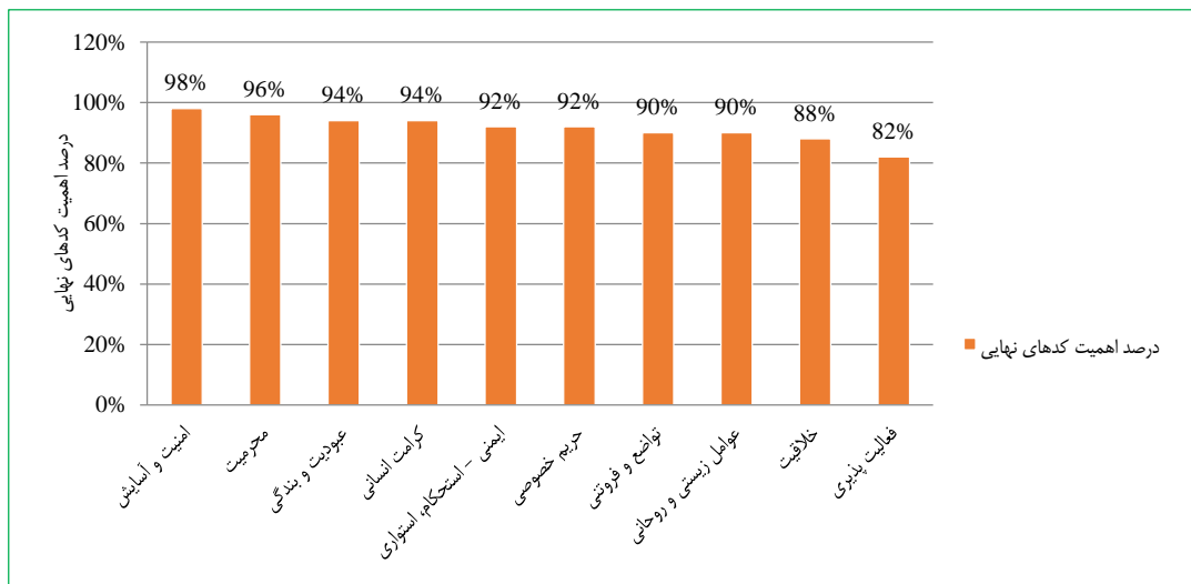
شکل ۲- نمودار اهمیت مؤلفه‌های تأثیرگذار انسانی قرآنی در معماری مسکن آپارتمانی معاصر