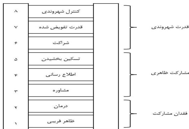
شکل ۱- نردبان مشارکت آرنشتاین - منبع: Arnstein ۱۹۶۹