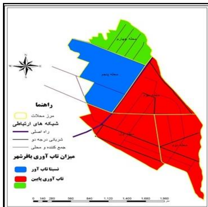
شکل ۳- نقشه نهایی تاب‌آوری شهر باقرشهر در برابر مخاطرات طبیعی- ترسیم: نگارندگان تحقیق؛ ۱۳۹۸.

نتایج به دست آمده از شکل ۳ نشان داد که وضعیت تاب‌آوری سه محله جنوب شهر از میزان تاب‌آوری کمتری نسبت به دو محله دیگر که در شمال خیابان اصلی شهر (خیابان شهیدرجائی) قرار دارد، برخوردار است. در این محلات تراکم ساختمانی و جمعیت از میزان بالاتری برخوردار بوده و در کنار این ویژگی‌های بافت کالبدی آن‌ها دارای ریزدانه‌گی و نفوذناپذیری زیادی برخوردار است. از طرفی وجود صنایع و کارگاه‌هایی که در بخش‌های شمالی شهر هستند، می‌توانند در مواقع وقوع بحران آثار سوئی بر این محلات داشته باشند. دلیل اینکه محلات شمالی دارای تاب‌آوری بالاتری نسبت به محلات جنوب شهر هستند این است که ویژگی‌های کالبدی این محلات از وضعیت بهتری برخوردار بوده و تراکم جمعیت و ساختمانی در آنها کم‌تر است.