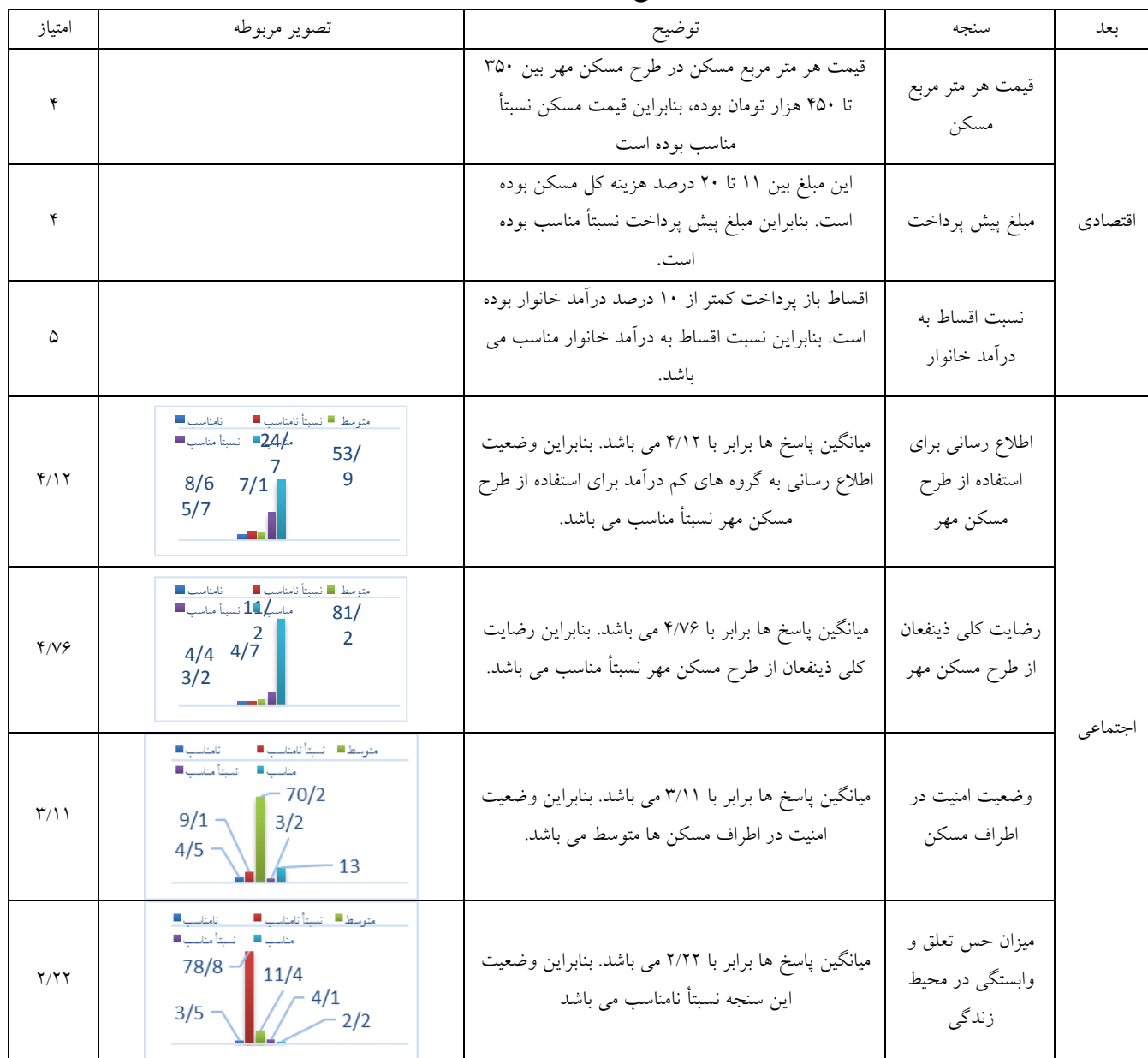
جدول ۵- امتیازدهی سنج‌های ارزیابی طرح مسکن مهر شهر شهرضا به لحاظ ابعاد اقتصادی و اجتماعی