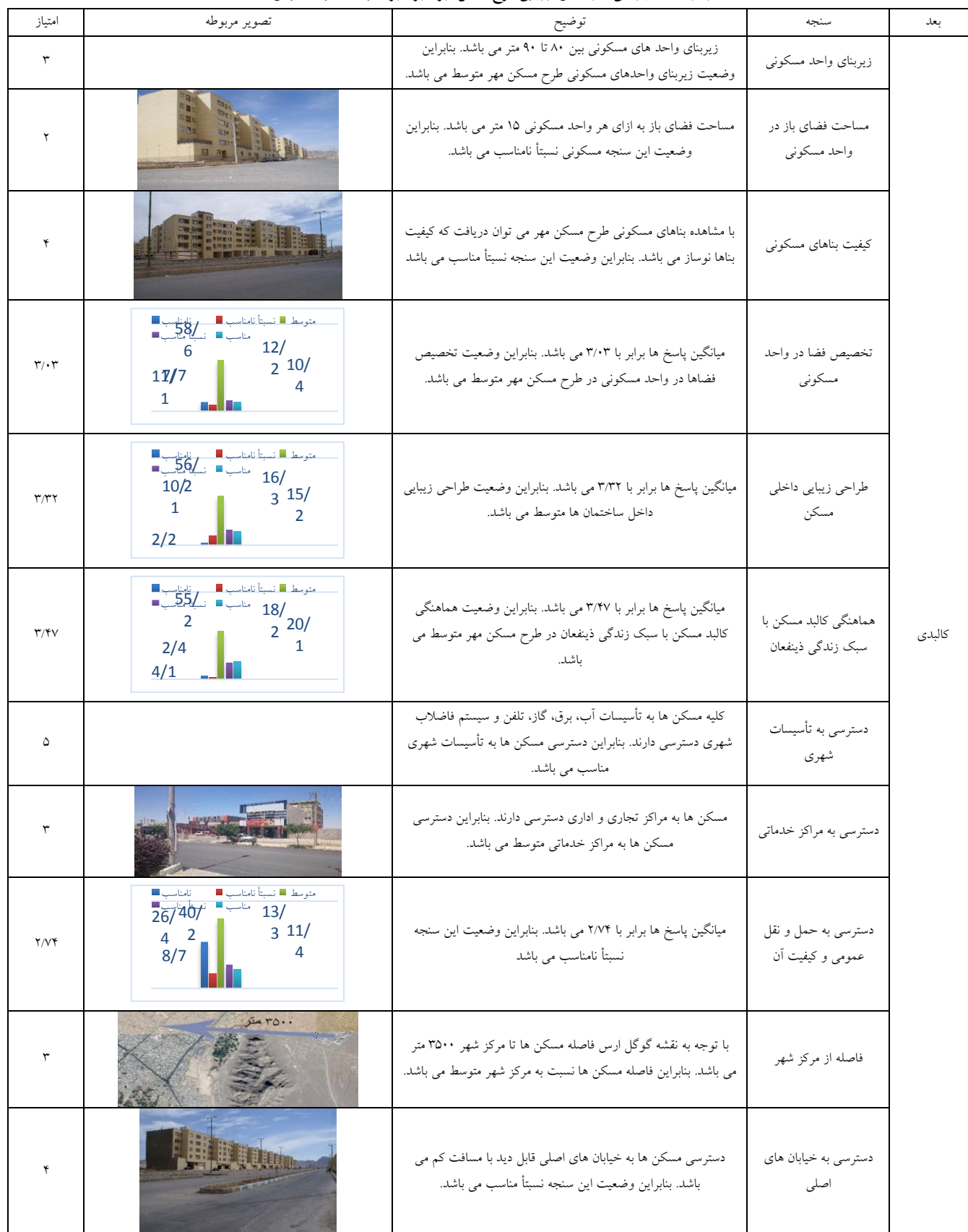
جدول ۷- امتیازدهی سنجه های ارزیابی طرح مسکن مهر شهر شهربان به لحاظ بعد کالبدی