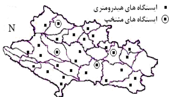
شکل ۲- محدوده واحدهای هیدرولوژیکی و موقعیت ایستگاه‌های هیدرومتری و منتخب مورد مطالعه.