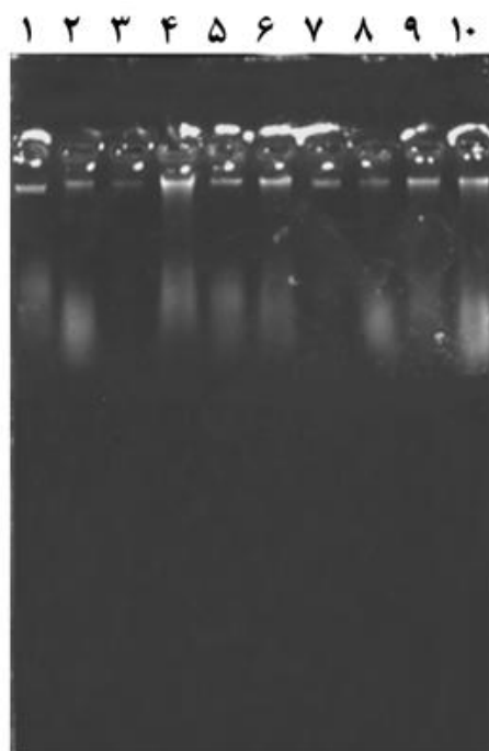
شکل 1- باندهای حاصل از الکتروفورز DNA استخراجی ده جدایه قارچ: 1- Aspergillus flavus 2- Aspergillus 3- Aspergillus ochraceus 4- Alternaria alternata 5- Rhizoctonia solani 6- Fusarium sp. 7- Trichoderma harzianum 8- Macrophomina sp. 9- Paecilomyces sp. 10- Chaetomium sp.

جدول 2- نتایج اسپکتروفتومتر DNA استخراجی ده جدایه قارچ با دستگاه نانودراپ.