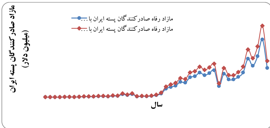
نمودار (۳) - روند تغییرات مآزاد رفاه صادر کنندگان پسته با توجه به نوع سیاست ارزی انتخابی