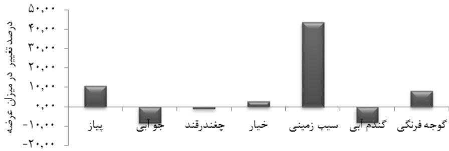
نمودار ۱- درصد تغییر در مقدار عرضه محصولات در سناریوی ۱۰۰ درصد افزایش قیمت گندم.