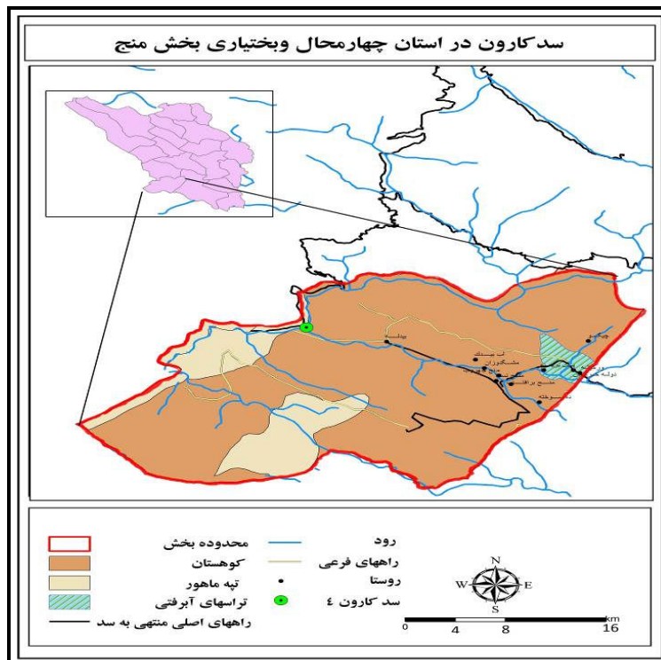
شکل شماره ۱، نقشه موقعیت سد کارون ۴ در استان چهارمحال و بختیاری

۵۷ ثانیه عرض جغرافیایی که توسط شرکت مهندسی مشاور «مهتاب قدس» و شرکت توسعه منابع آب و نیروی ایران منعقد گردیده، هم اکنون مراحل پایانی خود را طی می‌کند. این سد اولین سد در مسیر کارون نسبت به سرچشمه بر روی رودخانه کارون و بلندترین سد بتنی دو قوسی ساخته شده در کشور با ارتفاع ۲۳۰ متر است. تنظیم آب رودخانه کارون به میزان سه میلیارد و ۷۰۰ میلیون متر مکعب در سال، کنترل طغیان و سیلاب‌های مخرب رودخانه کارون، تولید انرژی برق آبی به میزان دو میلیارد و ۱۰۷ میلیون کیلووات ساعت از جمله اهداف ساخت سد کارون ۴ است (مهندسان مشاور طراحان البرز، ۲۰۰: ۱۳۹۰).