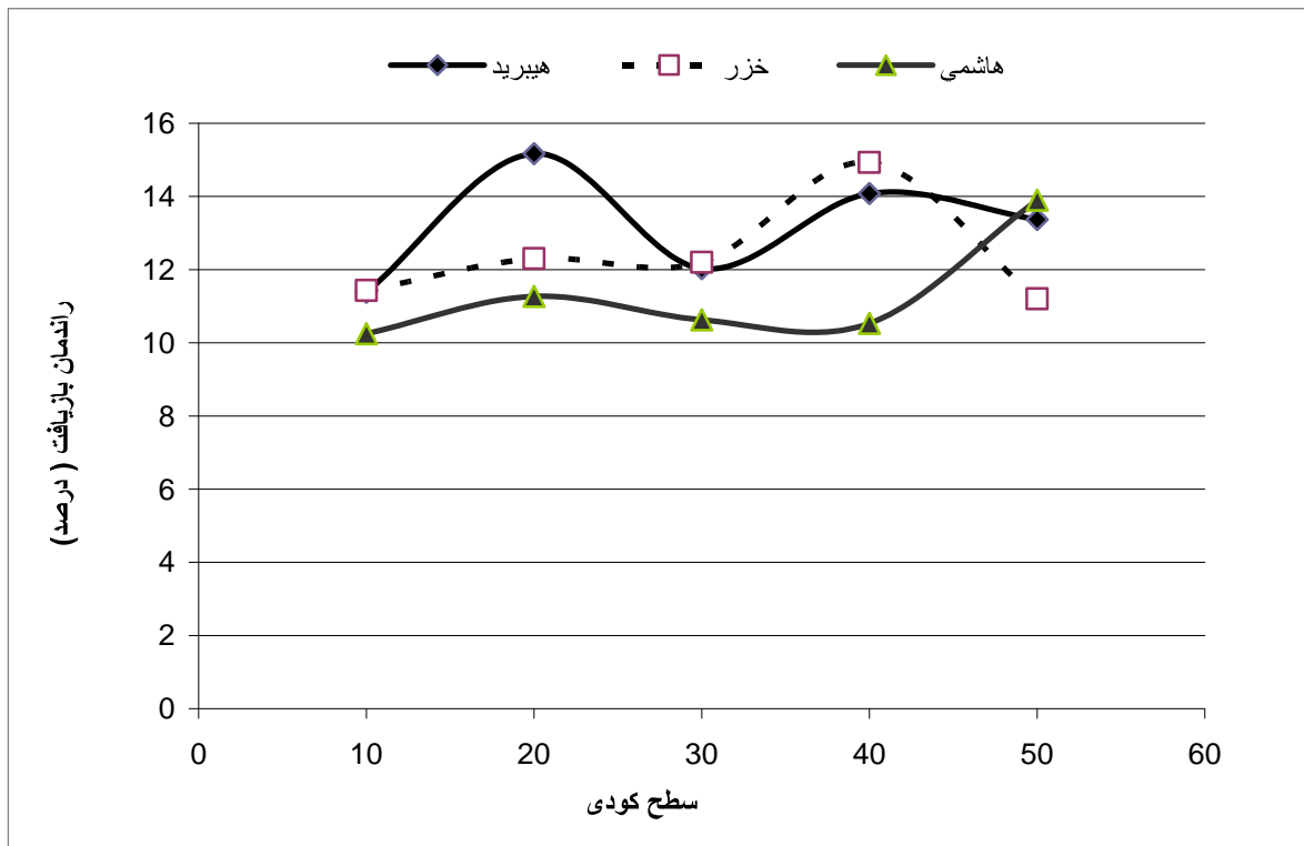
نمودار ۲- تغییرات راندمان بازیافت در ارقام مختلف و سطوح کودی مختلف