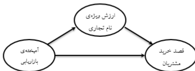
شکل ۱- طرح‌واره‌ی تأثیر مستقیم آمیخته‌ی بازاریابی بر قصد خرید مشتریان و تأثیر غیرمستقیم آن از طریق ارزش ویژه‌ی نام تجاری

هدفی که این مقاله دنبال می‌کند، بررسی تجربی تأثیر مستقیم محصول و قیمت آن در قصد خرید مشتریان شرکت پوشاک هاگوپیان و همچنین تأثیر غیرمستقیم آن‌ها از طریق ارزش ویژه‌ی نام تجاری می‌باشد که در شکل ۱ به صورت شماتیک نشان داده شده است.