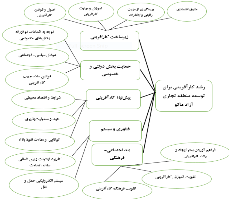
شکل ۱- مدل رشد کارآفرینی برای توسعه مناطق آزاد بر اساس تامین منافع جامعه محلی