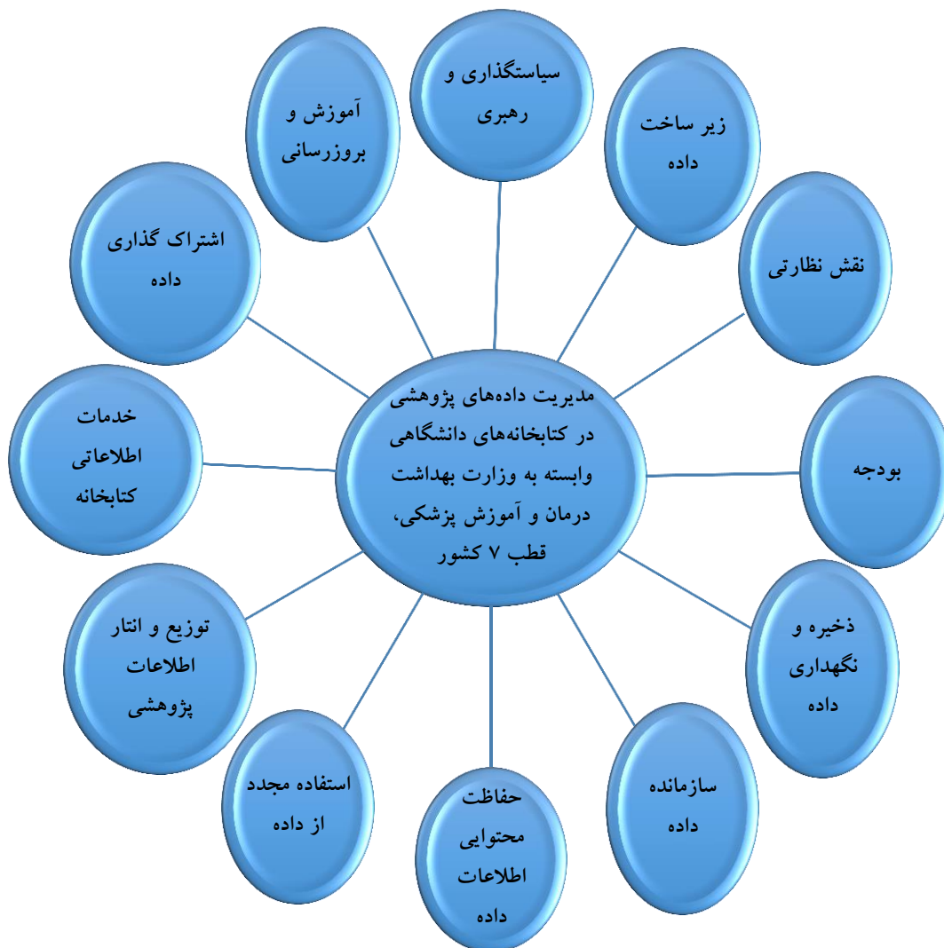
شکل (۱): الگوی نهایی مدیریت داده‌های پژوهشی در کتابخانه‌های دانشگاهی علوم پزشکی، قطب ۷ کشور

مؤلفه‌های مدل، در نهایت الگوی مدیریت داده‌های پژوهشی در کتابخانه‌های دانشگاهی وابسته به وزارت بهداشت، درمان و آموزش پزشکی قطب ۷ کشور به صورت زیر ترسیم شده است: