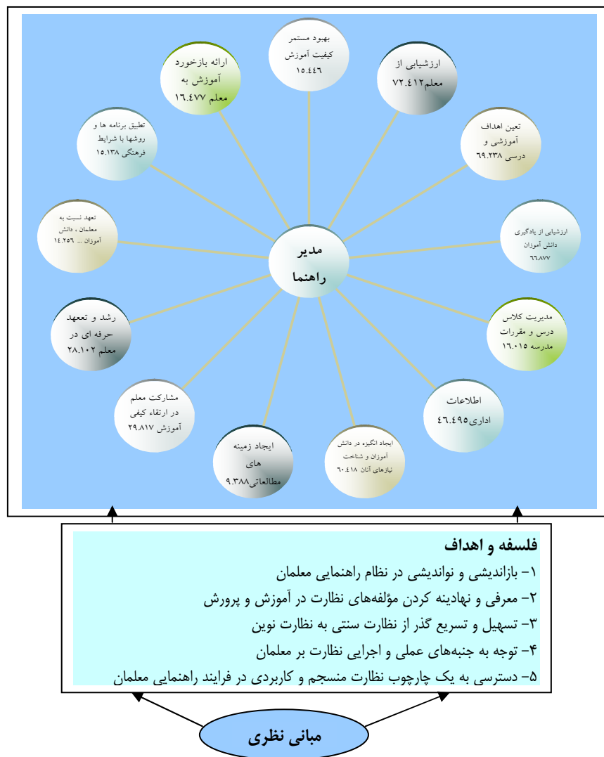
شکل ۲: مدل کارکردهای نظارتی "مدیر راهنما"

یکی از وظایف مهم مدیران، راهنمایی معلمان تازه کار و کم تجربه بود که امروز هم ادامه دارد. مدیران وظیفه دارند نسبت به تحقق هدف‌های آموزشی اهتمام ورزند و در این راستا سهم معلمان بسیار ارزشمند است. از این رو مدیران تا جایی که برایشان مقدور است و صلاحیت و شایستگی آنان اجازه می‌دهد، باید معلمان را راهنمایی نمایند.