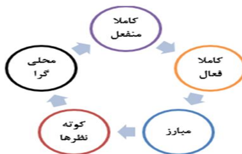
شکل ۲- گونه‌شناسی میلیبراث (۱۹۸۳) از مشارکت سیاسی