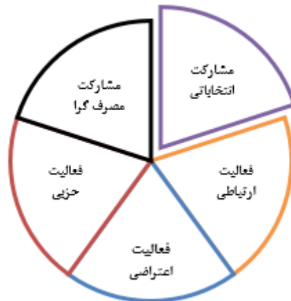
شکل ۱- گونه‌شناسی مشارکت از دیدگاه تئورل (۲۰۰۶)