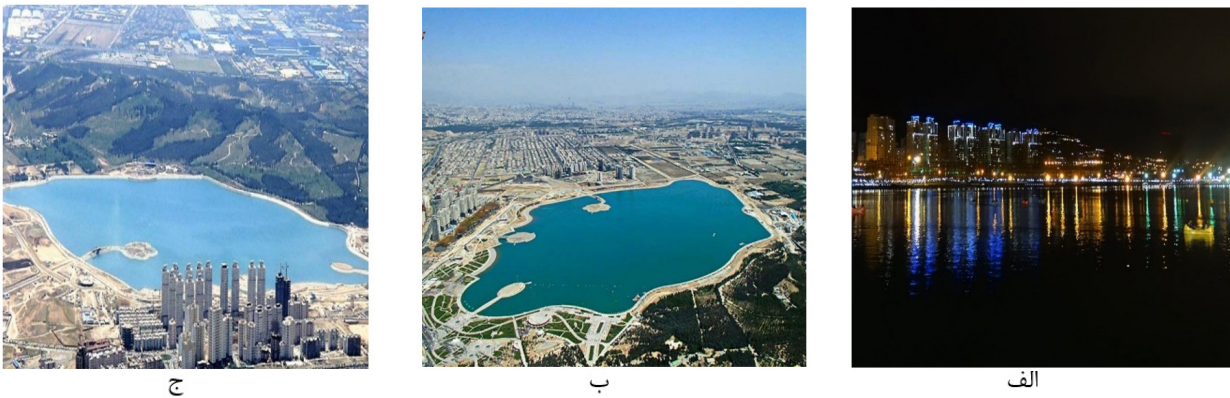
شکل ۱. نمونه‌های عملی از تأثیرات مثبت این سازه‌ها بر کیفیت بصری و اجتماعی (الف) انعکاس نور در دریاچه (ب) ارتباط فضای سبز و محیط دریاچه (ج) نمای دید و نحوه تأثیر فضای سبز همراه با توپوگرافی Figure 1. Practical examples of the positive effects of these structures on the visual and social quality: a) light reflection in the hole b) connection between the green space and the lake environment c) the view and the effect of the green space along with the topography

بر اساس تحلیل مبانی نظری بیان شده، جدولی از معیارهای پیشنهادی این پژوهش ارائه شد تا اساس کار تحلیل نمونه مطالعاتی و جمع‌بندی نهایی قرار گیرد. در جدول ۱ معیارهای اساسی در چهار بعد کالبدی - زیست‌محیطی و معماری منظری، اجتماعی، اقتصادی و مدیریتی بیان شد. از مجموع دو گروه شاخص و معیار فوق می‌توان به معیارهای زیر دست یافت که مدل تحلیلی این مطالعه را تشکیل می‌دهند. به عبارت دیگر مدل تحلیل زیر شامل معیارها و نقشه‌هایی است که بستر یک دریاچه مصنوعی مطلوب را با توجه به کیفیت بصری معماری منظر فراهم می‌آورد (شکل ۲).