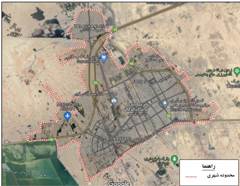
شکل ۲- عکس هوایی موقعیت محدوده شهری بندرماهشهر