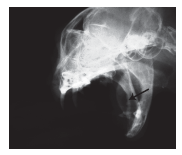
تصویر ۲ – رادیوگراف جمجمه گربه، نمای oblique با دهان باز، لیز استخوانی در لبه اَلوئولار فک پایین با فلش مشخص شده است.

با توجه به ظاهر تومور، رادیوگراف تهیه شده از جمجمه و میزان بالای وقوع نئوپلازیهایی نظیر SCC و فیبروسارکوما در محوطهی دهانی گربهها، احتمال نئوپلازی به خصوص از نوع فیبروسارکوما در مورد توده مورد نظر افزایش یافت.