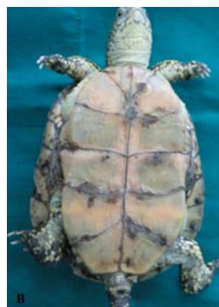
تصویر ۳- تصویر A بعد از جراحی پنکتومی و تصویر B بعد از برداشت بخیه ها