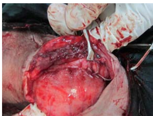
تصویر ۴- تثبیت لایه سروزی کولون به دیواره سمت راست شکم