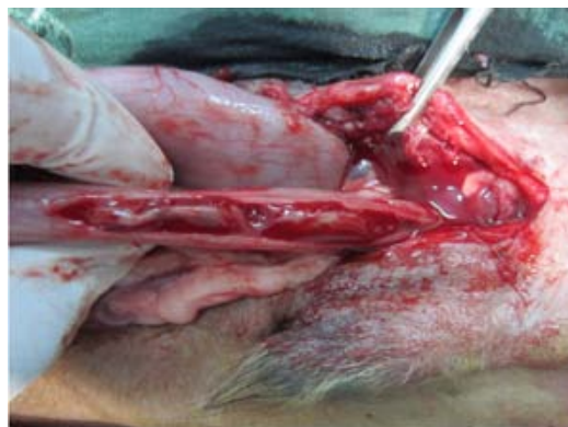
تصویر ۳- برش طولی بر روی لایه سروزی کولون نزولی

کمتری داشته باشد بایستی توسط برداشت مخاط یا برداشت کامل بافت مرده و سپس اتصال دو بافت زنده و سالم به یکدیگر اصلاح نمود (۴). هر دو روش جراحی کولوپیکسی و روش بخیه ساده سر کیسه‌ای در جلوگیری از عود مجدد پرولاپس رکتوم موثر شناخته شده‌اند (۲ و ۳ و ۵). هر چند در مورد بیمار مورد مطالعه، روش بخیه ساده، موثر نبوده ولی روش جراحی تثبیت کولون به دیواره شکم، کاملاً مفید واقع گردید.