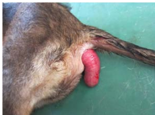
تصویر ۱- رکتوم پرولاپس یافته در تولد سگ نژاد ژرمن شفرد مخلوط

یک قلابه سگ نر ۶ ماهه نژاد ژرمن شفرد با وزن ۱۰ کیلوگرم به درمانگاه خصوصی دام‌های کوچک ارجاع داده شد. پس از اخذ تاریخچه و معاینات بالینی مشخص گردید، بیمار به مدت ۱۴ هفته دچار پرولاپس رکتوم عود کننده می‌باشد و به همین دلیل (پرولاپس رکتوم) بیمار مراجعات زیادی به دامپزشکان داشته و چندین بار مورد درمان قرار گرفته و در نهایت بخیه سر کیسه‌ای برای تثبیت و عدم بیرون زدگی رکتوم استفاده گردیده که هیچکدام از درمان‌های صورت گرفته موثر واقع نشده بود (تصویر ۱).