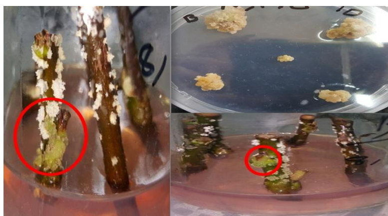
شکل ۲- ایجاد کالوس در اطراف جوانه‌های روی ساقه Figure 2. Create callus around the buds on the stems

نتایج تجزیه واریانس صفات مورد بررسی در واگشت اول و دوم به ترتیب در جدول ۱ و ۲ ارائه شده است. بر اساس نتایج بدست آمده، اختلاف معنی‌داری میان سطوح مختلف تنظیم‌کننده رشد نامبرده در سطح احتمال ۱ درصد برای تمامی صفات مورد بررسی در واگشت اول و دوم ملاحظه گردید. معنی‌دار شدن این عامل نشان از وجود پاسخ‌های متفاوت گیاه "به" به سطوح مختلف هورمون مذکور از لحاظ کالوس‌دهی می‌دهد. اثر ریزنمونه در سطح احتمال ۱