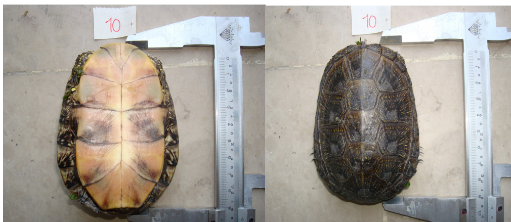
شکل ۱- لاک پشت برکه‌ای اروپایی از سطح پشتی (سمت راست) و شکمی (سمت چپ): هزاوه، ۱۳۸۹.

گلستان بسیار نزدیک به هم واقع شده‌اند (شکل ۱). پراکنش نمونه‌ها بر اساس توابع جدایی جمعیت‌ها (تابع یک و دو) نیز نشان داده شده است (شکل ۲). صفات طول کاراپاس (CL)، عرض کاراپاس (CW) و طول دنده‌ای سوم (CL3) بیشترین اثر را روی مولفه اول دارند. تحلیل خوشه‌ای (Cluster) نشان می‌دهد که جمعیت‌های بطور جداگانه واقع شده‌اند ولی یکی از نمونه‌های آذربایجان شرقی در خوشه‌ای جداگانه قرار گرفته است. همانطور که شکل ۳ نشان می‌دهد جمعیت‌های گلستان و مازندران در یک فوق خوشه و جمعیت‌های اردبیل و آذربایجان شرقی در یک فوق خوشه دیگر واقع شده‌اند.