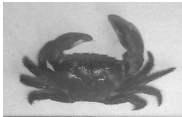
شکل ۴ - خرچنگ ( Eriphia sebana )

لازم است از مساعدت و همکاری دوستان و همکاران عزیز در مرکز بندر عباس موسسه تحقیقات شیلات ایران آبهای دور