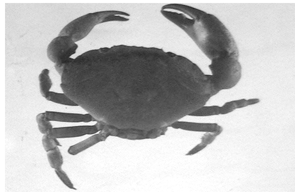
شکل ۲ - خرچنگ پهن مرجانی ( Atergatis sp )

محل صید: نواحی صخره ای جزیره هرمز و فانوس دریایی جاسک (شکل - ۴)