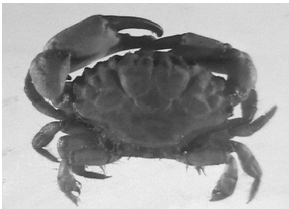
شکل ۱- خرچنگ ( Xantho exaratus )