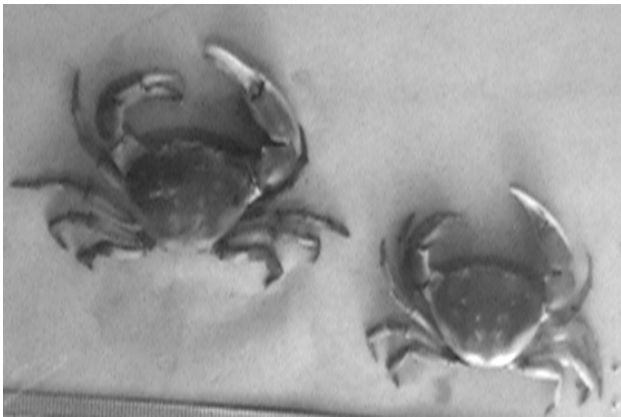
(شکل - ۳) خرچنگ پهن ( Eurycarinus orientalis )

محل صید: منطقه تیاب (استخرهای پرورش میگو) و سواحل گلی خور شیلات و جاسک (شکل - ۳)