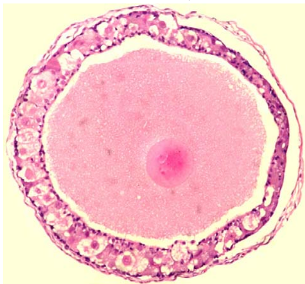
شکل ۳- لایه فولیکولی پلی‌مورف و چندلایه در فولیکول در حال رشد (با درشتنمایی \times 400 )