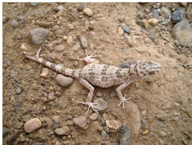
شکل ۱- ماده‌ی بارور حامل تخم در اردیبهشت ماه